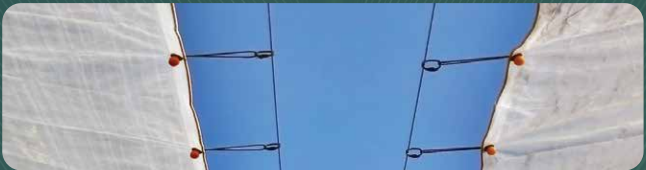
Clip ovalado 21B

Nota: Los datos técnicos anteriores son valores medios basados en pruebas de producción y de institutos independientes con fines orientativos.